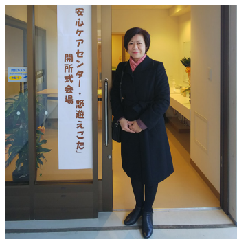
▲ 安心ケアセンター・悠遊えごた開所式(2月)