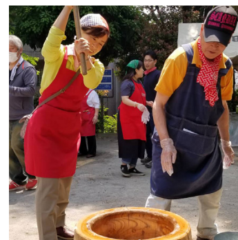
▲ 上高田二丁目町会定期総会・餅つき大会(5月)