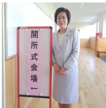
▲ キッズ・プラザ江原開所式(3月)