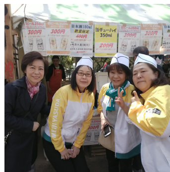
▲ 中野通り桜まつり(4月)