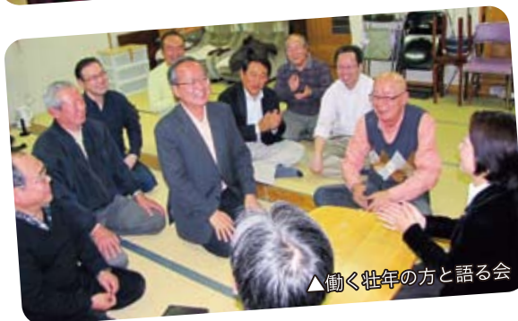
▲働く壮年の方と語る会