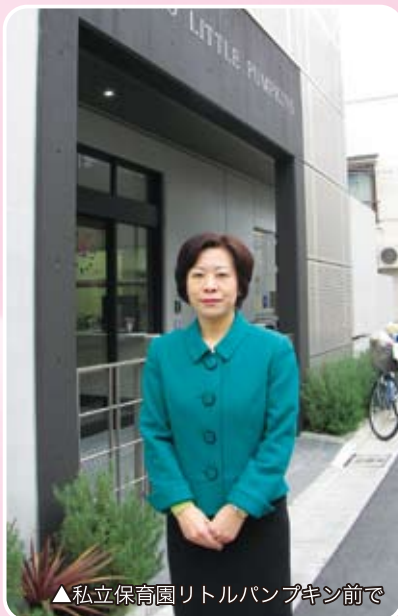
▲私立保育園リトルパンプキン前で

さらに、12月12日には私立保育園「リトルパンプキン」及び認知症グループホーム「ホームタウン友愛」を視察しました。