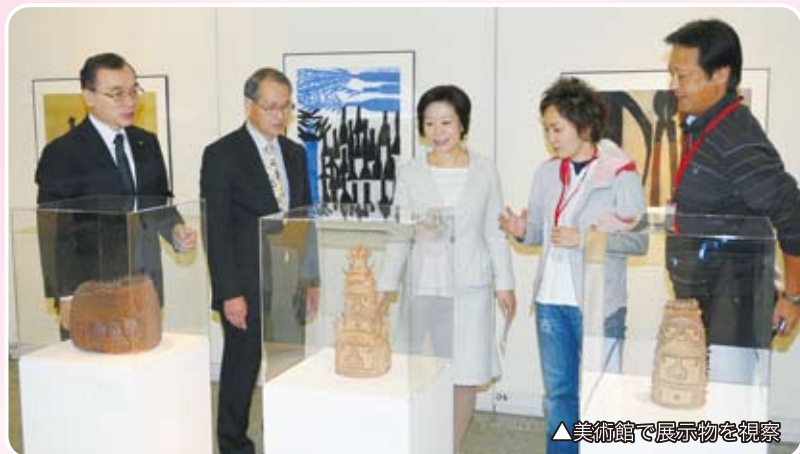
▲美術館で展示物を視察