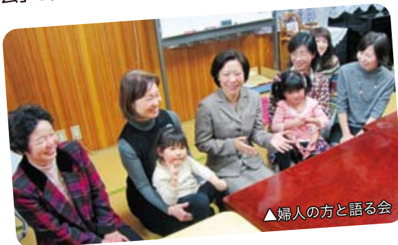
▲婦人の方と語る会