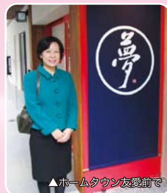
▲ホームタウン友愛前で