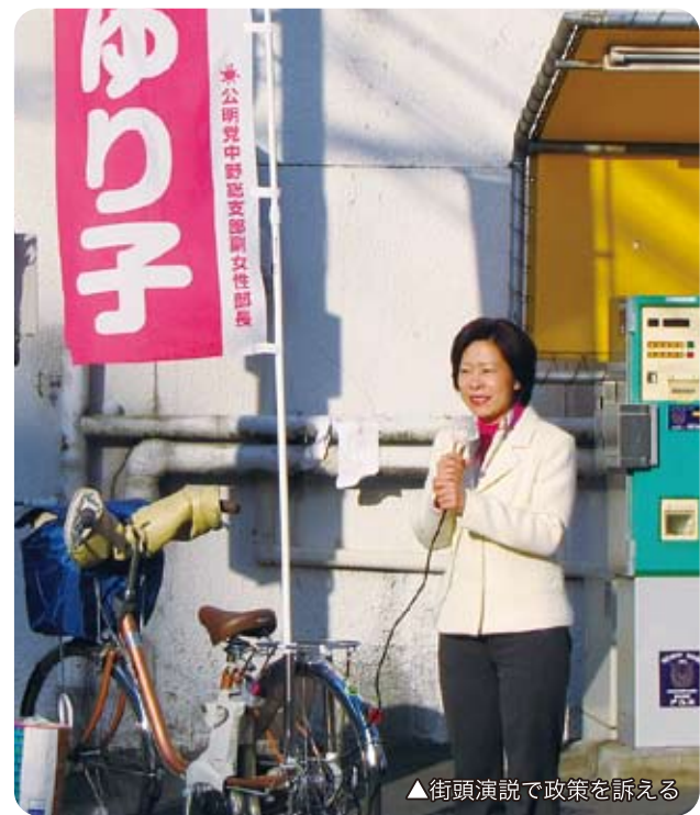
▲街頭演説で政策を訴える

20年間、民間企業で働いてきた経験を生かし、大好きな中野のために一生懸命働いてまいります！皆様の温かいご支援を心からお願い申し上げます。